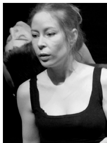
Cb* = Collectif barbare